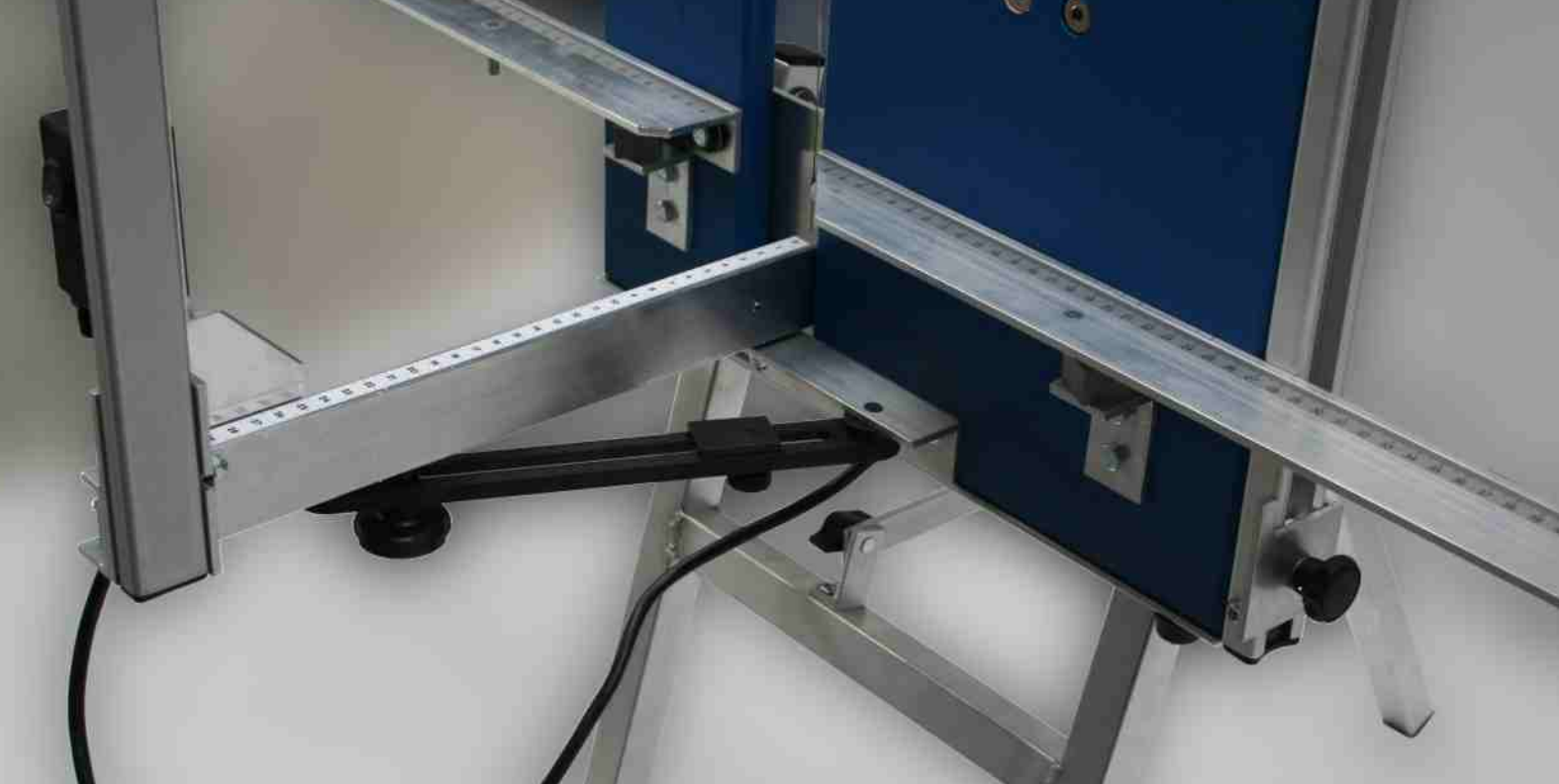
Accessori SPEWE 5100S-28